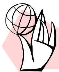
Didascalia dell'immagine o della fotografia

compiutamente per la prima volta al mondo l'orrore del genocidio nazista.